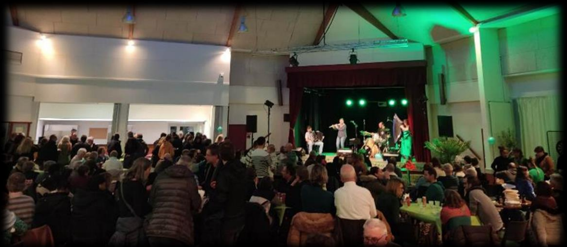
Figure 4: Saint-Patrick Sorigny 18 mars 2023 (37)