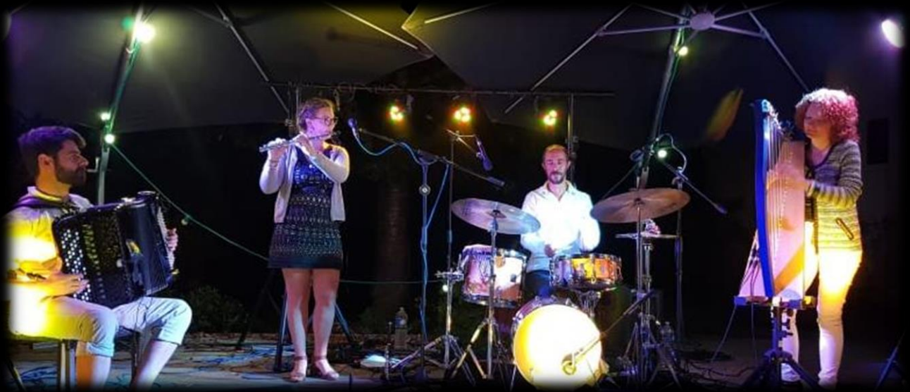
Figure 1: Festival international de la Harpe Gargillesse 18 août 2021 (36)