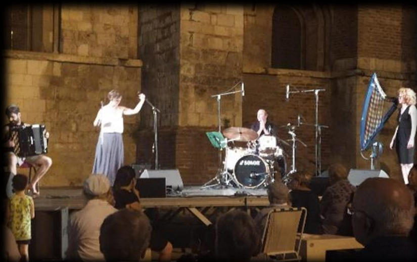
Figure 5: Concert Moissac 19 août 2023 (82)