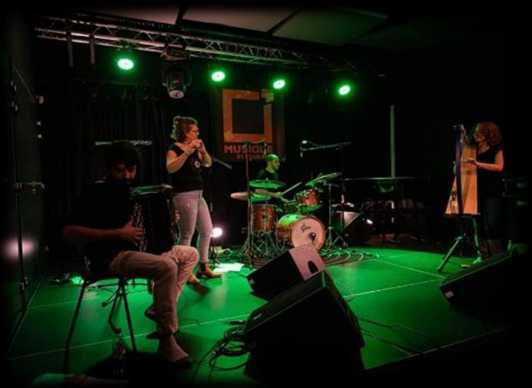
Figure 2: Release party Argonaute Orléans 17 mars 2022 (45)