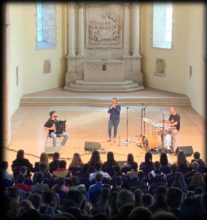
Figure 3: Festival de musique de Sully et du Loiret – 2022 (45)